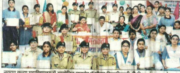
नवयुग कन्या महाविद्यालय में आयोजित समारोह में मौजूद जिलाधिकारी, शिक्षिकाएं व छात्राएं। संवाद