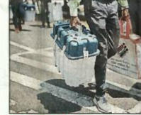
EVMs TO STAY

Though the court had reserved its verdict earlier, it held another hearing on Wednesday to clear doubts regarding technical functioning of EVMs and a deputy election commissioner, like on the last occasion, answered the court's