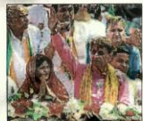
Arun Govil during a roadshow in Meerut on Wednesday.